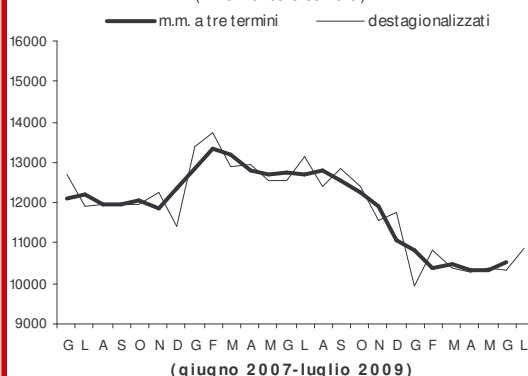
Esportazioni verso i paesi extra Ue (milioni di euro correnti)