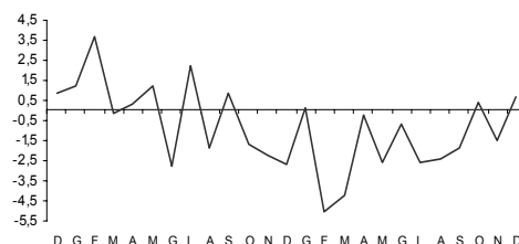
Indice del valore del totale delle vendite variazioni percentuali tendenziali