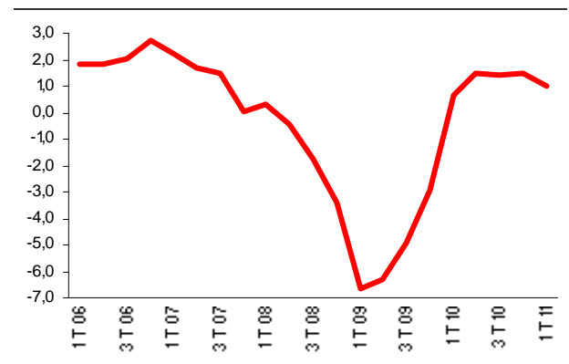
FIGURA 1. PRODOTTO INTERNO LORDO Variazioni tendenziali percentuali Dati destagionalizzati e corretti per gli effetti di calendario