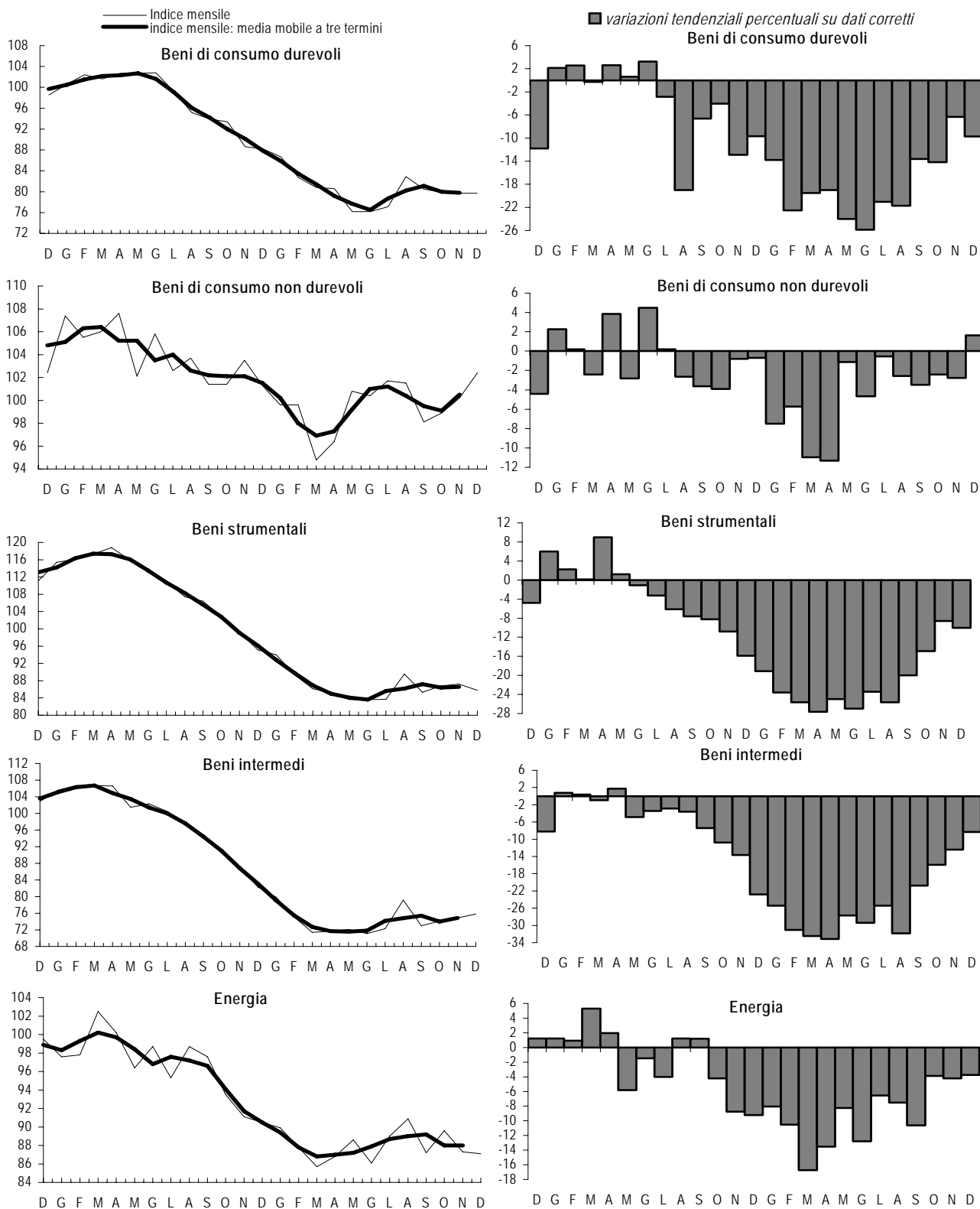
Quadro 1. Raggruppamenti principali di industrie: indici destagionalizzati e variazioni tendenziali percentuali su dati corretti per gli effetti di calendario. Dicembre 2007-Dicembre 2009